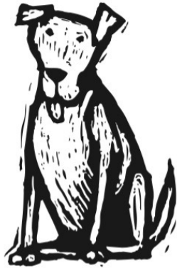
Der Hund sagt „wau-wau“

Fill in the blanks with the German word for what is pictured in each image. You will use this vocabulary in reading a famous German fairy tale, Die Bremer Stadtmusikanten .