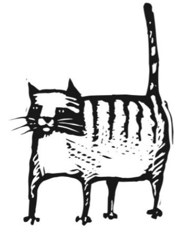
Die Katze sagt „miau“