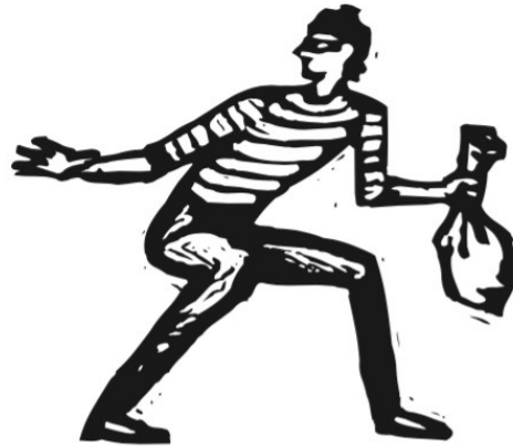
Der Räuber sagt „Ihr Geld oder Ihr leben.“