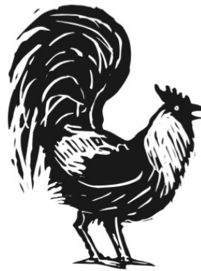
Der Hahn sagt „Kikiriki.“