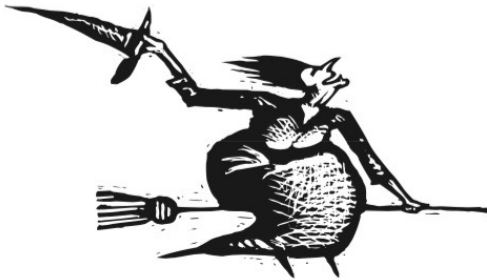
Die Hexe sagt „Du bist ein Frosch!“